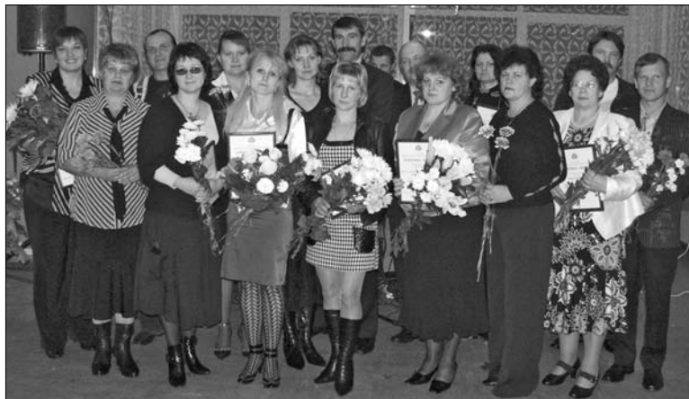
В день осенний, когда у порога Задыхали уже холода,

Школа празднует день педагога – Праздник мудрости, знаний, труда.