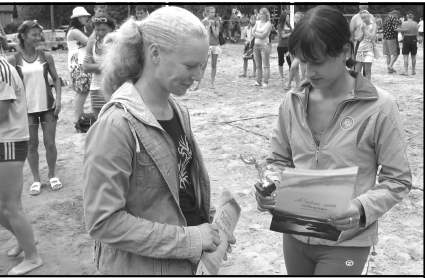
Копилка призов команды пополняется новыми наградами!

Летом девушки волейбольной команды Тискадской средней школы для поддержания спортивной формы, успешно принимали участие в различных соревнованиях по волейболу.