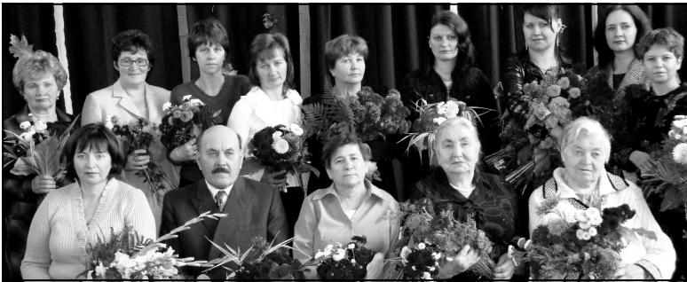
2 октября для наших учителей был особым днем - днем их профессионального праздника «Дня учителя». На один день их заместителями на уроках стали ученики старших классов.