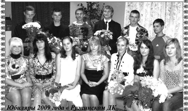
Юбиляры 2009 года в Ружинском ДК

Заведующая Ружинским ДК поздравляет своих юбиляров - тех, кому в этом 2009 году исполняется 18 лет! Восемнадцать - это рассвет Вашей жизни, что вся впереди. Пожелаем Вам большие побед, от удачи к удаче идти!