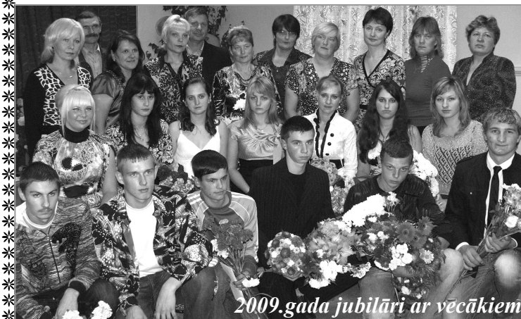
2009.gada jubilāri ar vecākiem