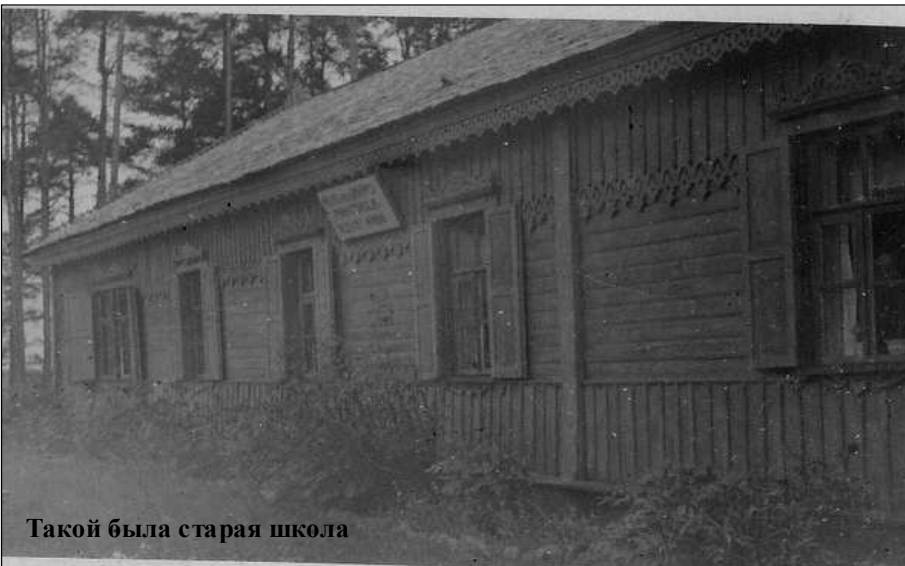
Такой была старая школа