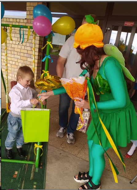
Silmalas pagasta kultūras darbinieki