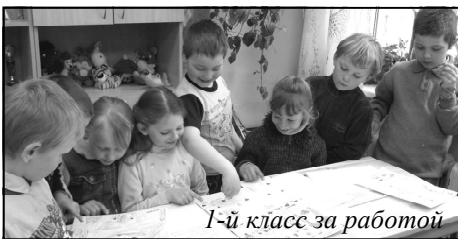
1-й класс за работой