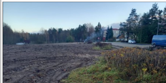
Ezera iela 34

Izteikt savus priekšlikumus un ierosinājumus var Silmalas pagasta pārvaldē (Saules iela 4, Gornica, Silmalas pag.) vai pa tālr. 26568623 (Jānis Laizāns).