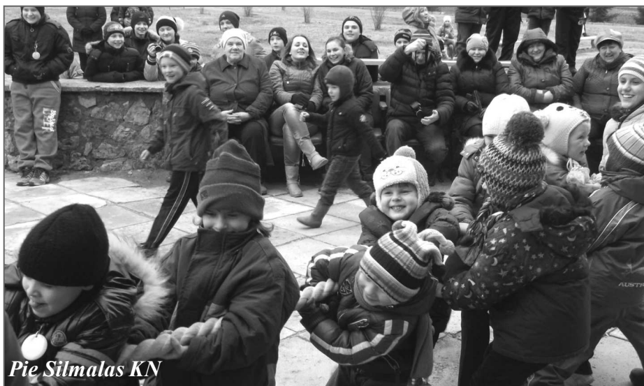
Pie Silmalas KN

Liels paldies visiem organizatoriem par šādiem pasākumiem skolās un klubos!