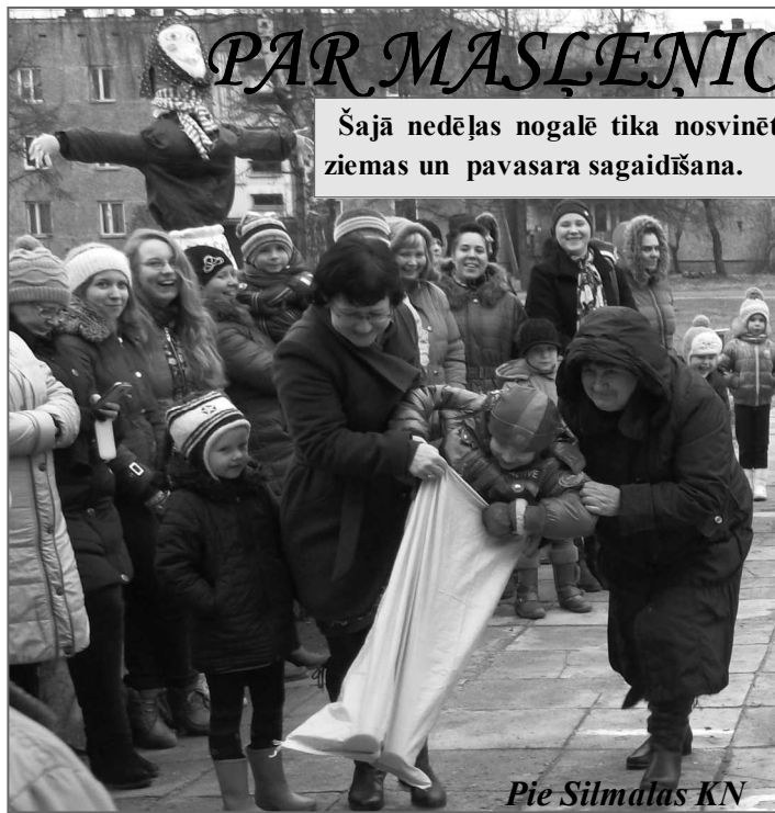
Pie Silmalas KN

Šajā nedēļas nogalē tika nosvinēta "Masleņica" - jautra atvadīšanās no ziemas un pavasara sagaidīšana.