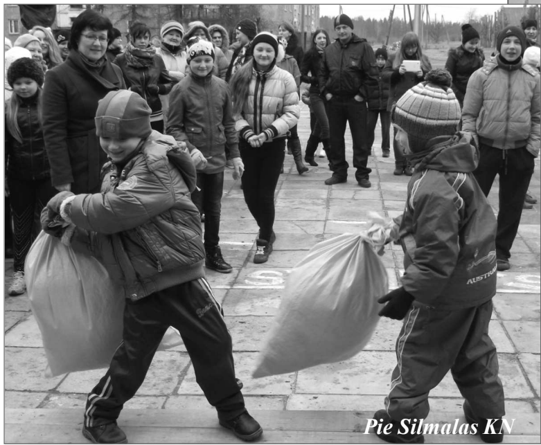
Pie Silmalas KN

Прошлая неделя в нашей волости была богата мероприятиями, так как и в школах, и в клубах прошли масленичные гуляния. О некоторых из них расскажем в этой статье.