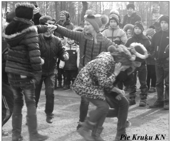
Pie Kruķu KN