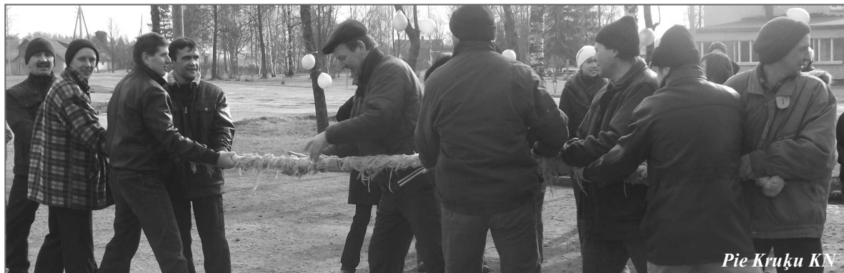
Pie Kruķu KN

Праздник подарил детям радость, массу впечатлений и заряд бодрости на весь день, а взрослым – возможность вернуться в детство. Большое спасибо всем организаторам таких праздников в школах и клубах волости, благодаря труду которых мы так замечательно проводили Зиму и встретили Весну!