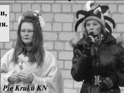
Pie Kruķu KN

28 февраля прошло празднование Масленицы в Круках. Дети и взрослые собрались у клуба проводить зиму и встретить весну. На празднике была сама Весна, задорные скоморохи и даже Блин. Были песни, частушки, танцы и игры. Как дети, так и взрослые, с огромным удовольствием принимали участие в разных конкурсах, “пекли блины”. Закончилось мероприятие сожжением чучела. Ну а после, все угощались горячим чаем и вкусными блинами. Блинов и веселья хватило на всех!