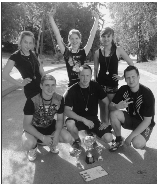
возможность, чтобы защитить честь нашей волости!

Надеюсь, что и дальше, молодежь нашей волости будет использовать каждую