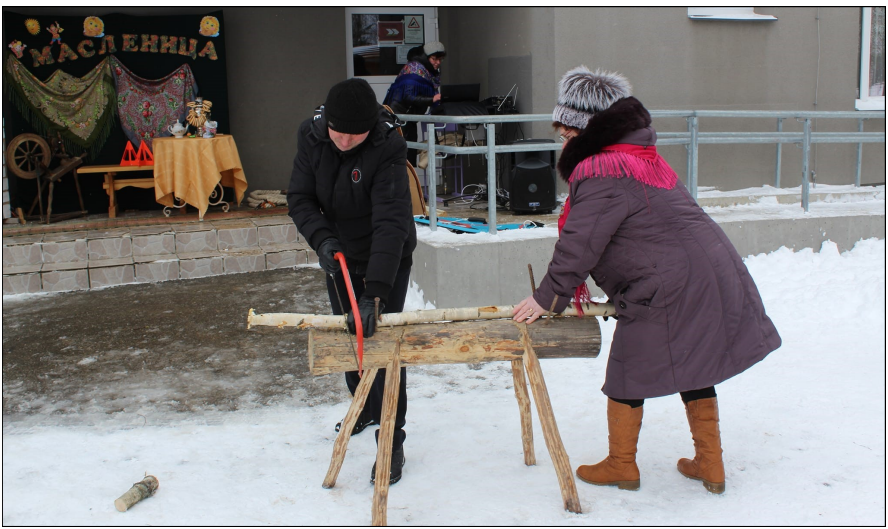
Каждый мог поучаствовать в традиционных играх и состязаниях.