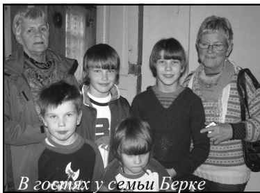
В гостях у семьи Берке