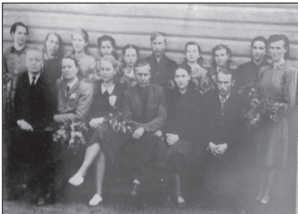
1950 год. Учителя и ученики.

В 1953 году из 10 учителей 5 имели среднее образование и 5- незаконченное высшее. В процессе работы в школе многие из них продолжали образование в Даугавпилском педагогическом институте на заочном отделении и, в конце концов, становились дипломированными педагогами.