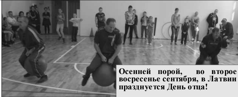
Осенней порой, во второе воскресенье сентября, в Латвии празднуется День отца!