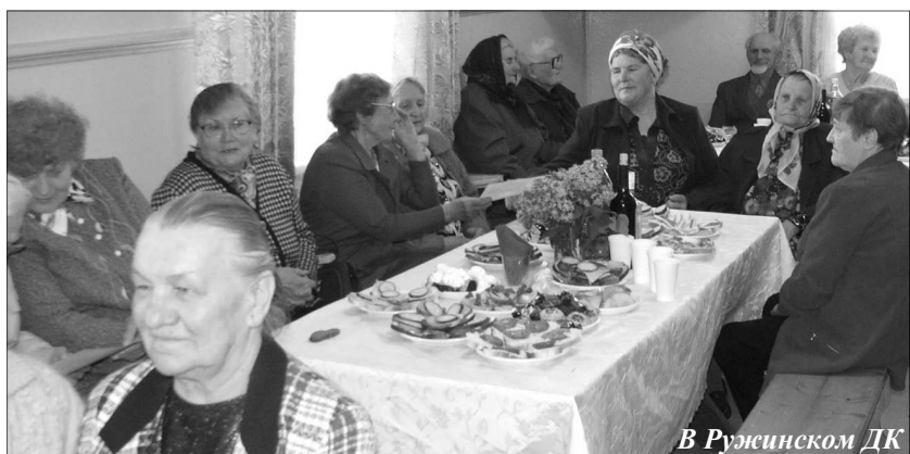
В Ружинском ДК

Глядя на радостные лица наших пенсионеров, невольно понимаешь, что и правда, года не беда, ведь душа их молода!