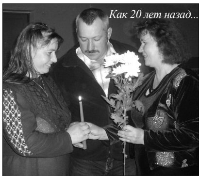
Как 20 лет назад...

Всем парам, которые празднуют в этом году свои юбилеи свадеб желаем, чтобы из года в год их чувства только крепли, а тем, кто еще находится в поисках второй половинки желаем встретить именно того человека, чтобы через много лет после свадьбы вы с такой же нежностью и теплотой могли отзываться друг о друге, как это делали в свой праздничный вечер юбиляры Штыканского ДК.