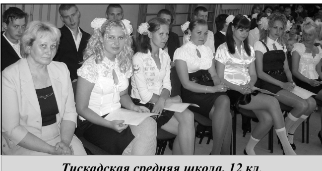
Тискадская средняя школа, 12 кл.

Последний звонок - это очень трогательное, торжественное событие, которое остается в памяти на всю жизнь. Впереди у выпускников большая взрослая жизнь, которая принесет им и радости, и разочарования. Но сначала - сдача государственных экзаменов. Удачи вам, ребята, и пусть будет как можно меньше препятствий на вашем жизненном пути!