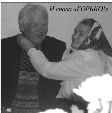
И снова «ГОРЬКО!»