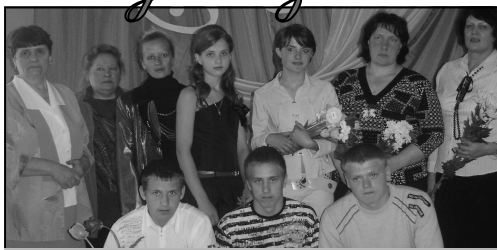
Силмалская основная школа, 9 кл.