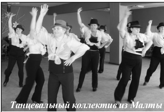
Танцевальный коллектив из Малты

Поэтому, уважаемые наши пенсионеры, знайте, что о вас помнят и очень ждут — больше не прогуливайте! А если серьезно, то желаем вам всем здоровья покрепче и проблем поменьше, чтобы и отдохнуть, и такие встречи посещать сил и времени у вас всегда хватало.