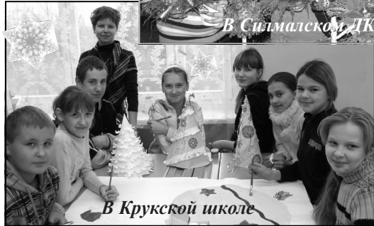
В Крукской школе