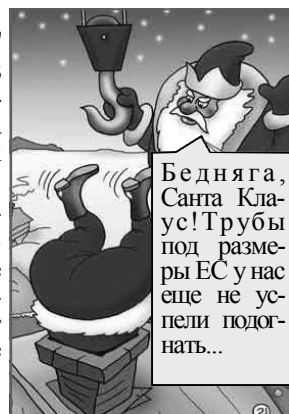
Бедняга, Санта Клаус! Трубы под размеры ЕС у нас еще не успели подогнать...

🍏 Каждый раз перед новым годом жена подносит мне кулак к носу и заявляет: - Не будешь пить в Новый год! Не будешь! А я в ответ ей улыбаюсь и радостно думаю про себя: "Почти 20 лет уже вместе живем, а сколько в ней еще оптимизма!"