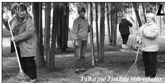
Talka pie Tiskādu vidusskolas

Silmalā KN vadītāja lūdz atsaukties tos, kuriem ir nevajadzīgi (bojāti) CD diski. Tie ir nepieciešami kluba noformējumam. Tālr. 22016605.