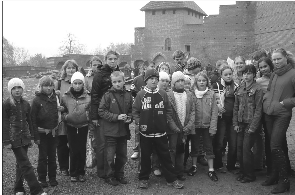
2008. gada 11. oktobrī mēs, Tiskādu vidusskolas skolēni, devāmies ekskursijā uz Siguldu. Brauciens izrādījās ļoti interesants un aizraujošs.

Mūsu ekskursija sākās ar Turaidas dabas parka apskati. Mēs apmeklējām karišu pagalmu, jo viduslaikos galvenais pārvietošanās līdzeklis bija karietes. Pēc karišu apskates pabijām istā pirtī, kura