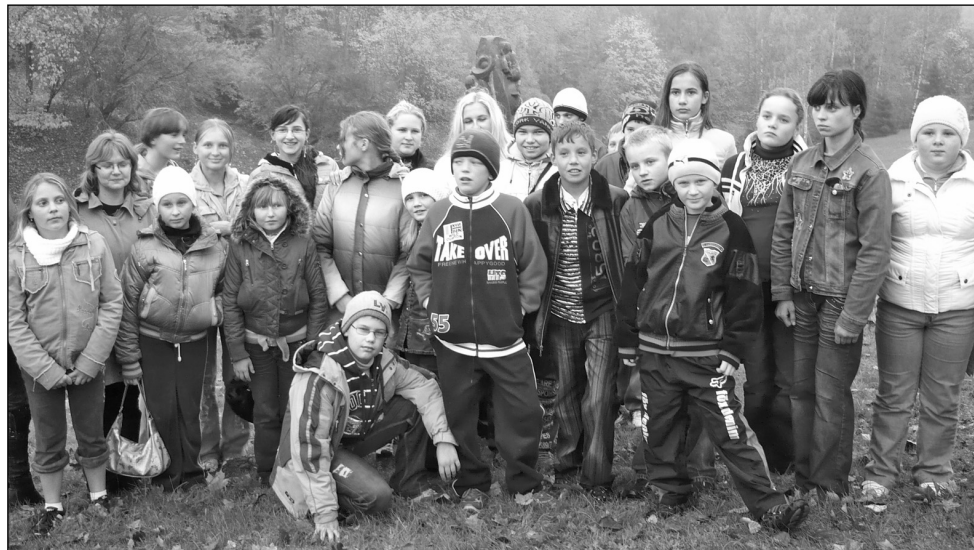
11 октября 2008 года мы, ученики Тискадской средней школы, поехали на экскурсию в Сигулду. Поездка оказалась очень интересной и увлекательной.

Наша экскурсия началась с осмотра Турайдского природного парка. Мы посетили каретный двор, ведь в средние века основным средством передвижения были кареты. После каретной побывали в настоящей бане, которая состоит из трёх помещений. В первом помещении крестьяне