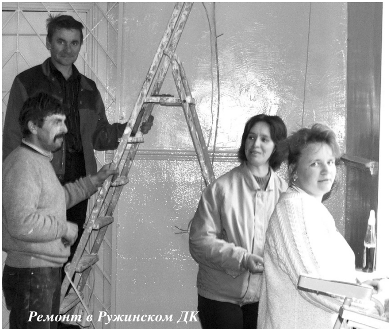
Ремонт в Ружинском ДК