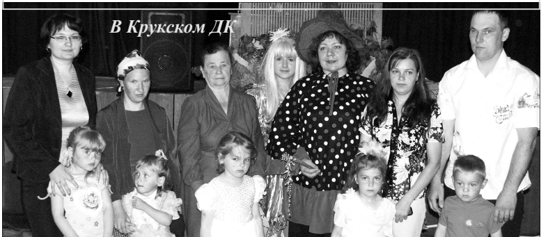
В Крукском ДК