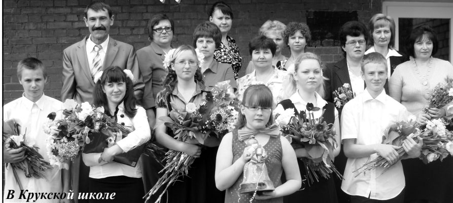
В Крукской школе

21 мая для выпускников этого учебного года в Тискадской средней и Крукской основной школах прозвенел последний звонок.